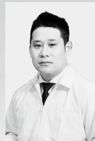
◆制作 / 鎌田明成