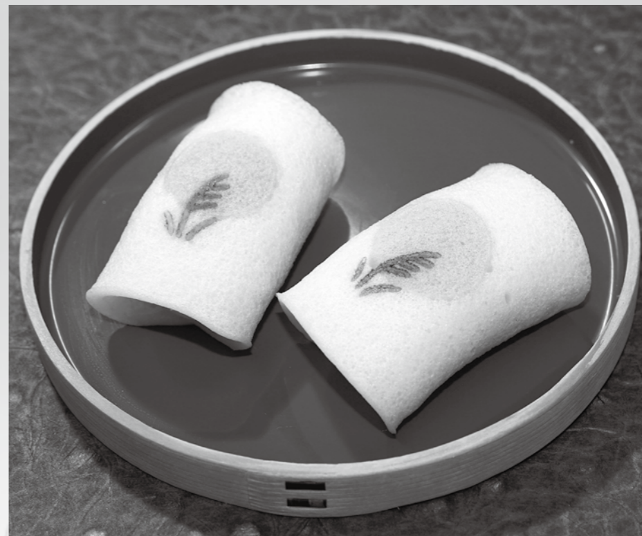
焼皮製桜餅を応用した